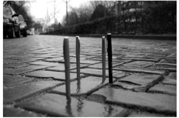
Ventweg met oneven nummers gelegd in maart 2008

Het voordeel van deze bestrating is dat het rustiek toont en dat er een aanzienlijke besparing is ge-