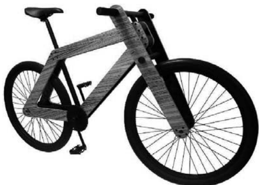
Sandwichbike van Bleijh