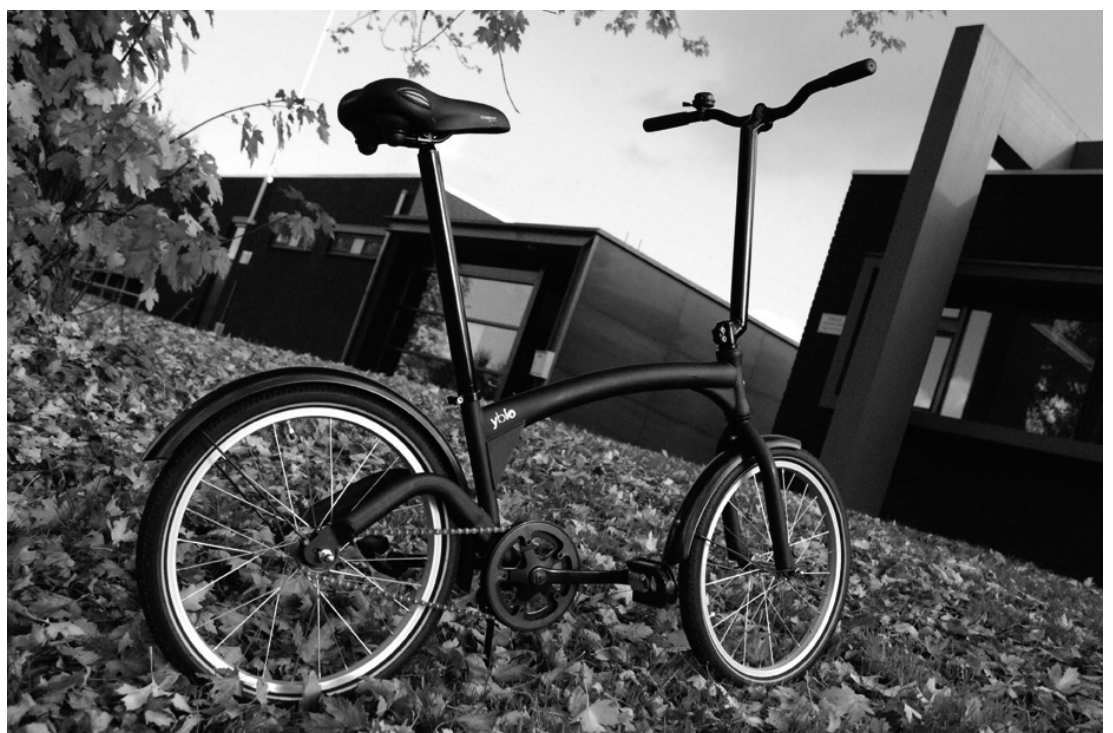
YBIO van Splinter Industrial Design