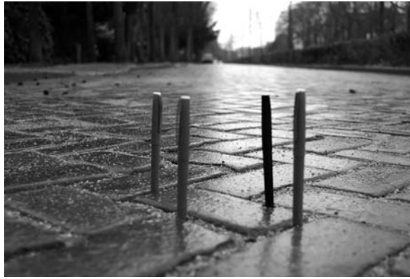
Ventweg met even nummers gelegd in februari 2008

maakt geen contact met zijn buurstenen en heeft dus alle gelegenheid om te bewegen. Probeer het zelf eens als je er langs komt: het is bij bijna elke steen prijs.