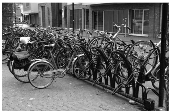
Marienburg: stuurdragersysteem vervangen door tulpmodel. Veel betere bevestigingsmogelijkheden voor het tweede slot.

Met de fiets boodschappen doen tot voor de winkel – maar op de drukke uren moet de fiets in het rek. Dat is het belangrijkste doel van het nieuwe fietsparkeerbeleid in het Nijmeegse centrum. Een doel dat de gemeente zich stelt na overleg met de ondernemers, de Fietsersbond en Milieudefensie. Nijmegen wil met de fiets boodschappen doen aantrekkelijker maken. Daarom zijn de afgelopen tijd in het centrum op verschillende plaatsen fietsenrekken bijgeplaatst. Er zijn nieuwe wegwijzers naar de grotere stallingen. En er komt een nieuw handhavingsbeleid. De handhaving wordt strenger – maar alleen op de momenten dat dit ook nodig is. 's Morgens met de fiets aan de hand de winkels langs. Even de fiets op de standaard en de winkel in. En weer verder. Dat werd gedoogd, maar binnenkort is het gewoon de bedoeling. Ook op zaterdag. 's Middags als het drukker is met voetgangers