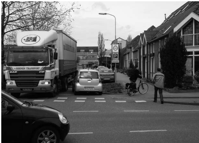
Ericastraat in Malden

Sinds 1 oktober mogen er geen fietsen meer in het winkelcentrum komen. Jammer. Zelden werden er fietsen ongelukkig geplaatst. De jongens en meisjes die de fietsen nu moeten weren, zouden toe kunnen zien op het juist stallen, dan deden ze